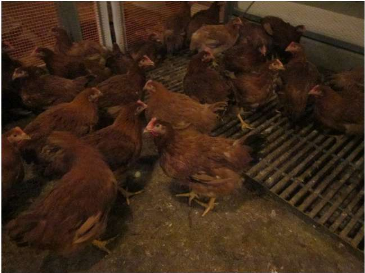
(図 3 - 6) <57×86♀> (CM♀) の飼養状況