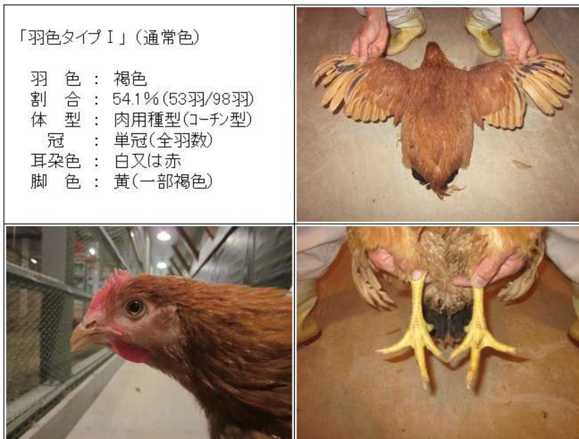
(図3-4) < 57×86♀ > (CM♀) 羽色タイプⅠの羽色・外貌の特徴