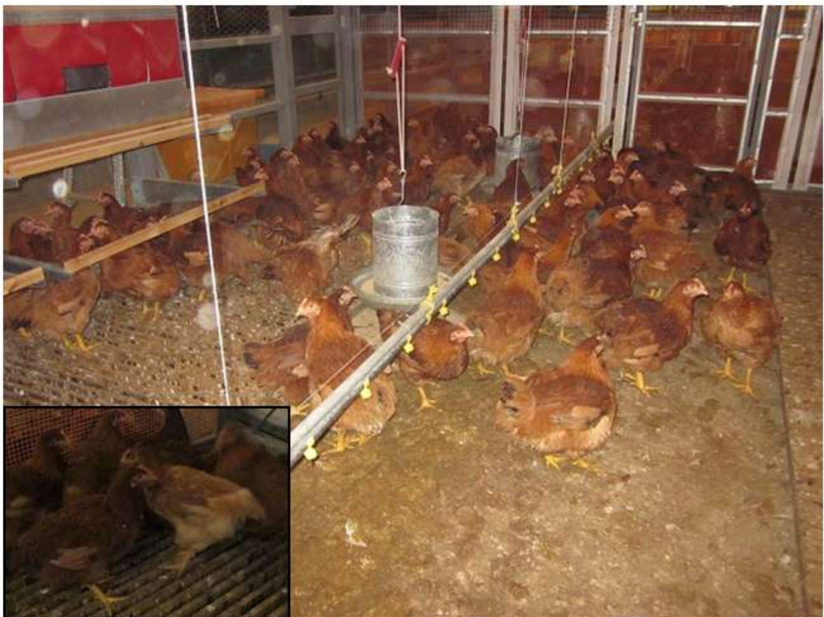
(図 3 - 7) <57×86♀> (CM♀) の飼養状況 (羽色の比較)