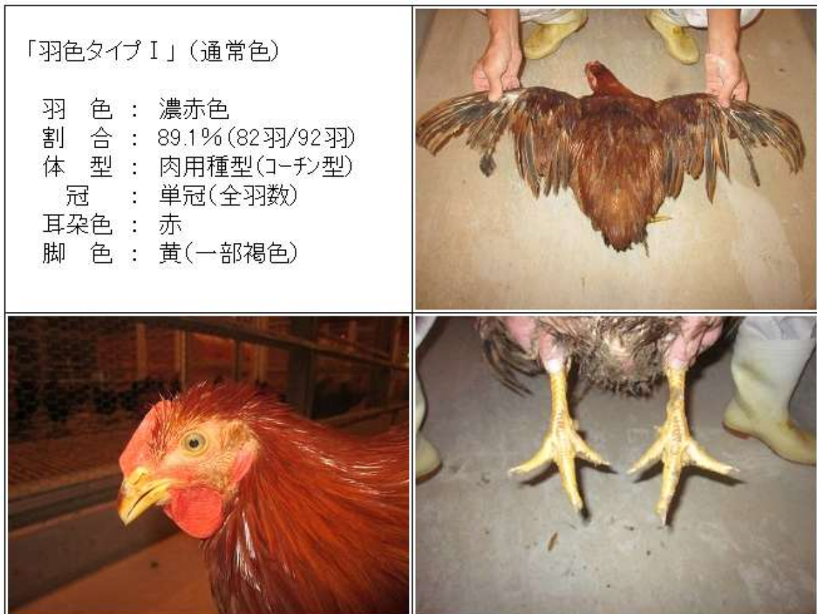
(図 3 - 1) <57×86♂> (CM♂) 羽色タイプ I の羽色・外貌の特徴