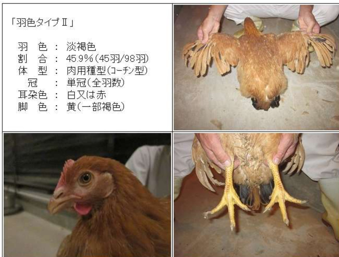
(図3-5) < 57×86♀ > (CM♀) 羽色タイプⅡの羽色・外貌の特徴