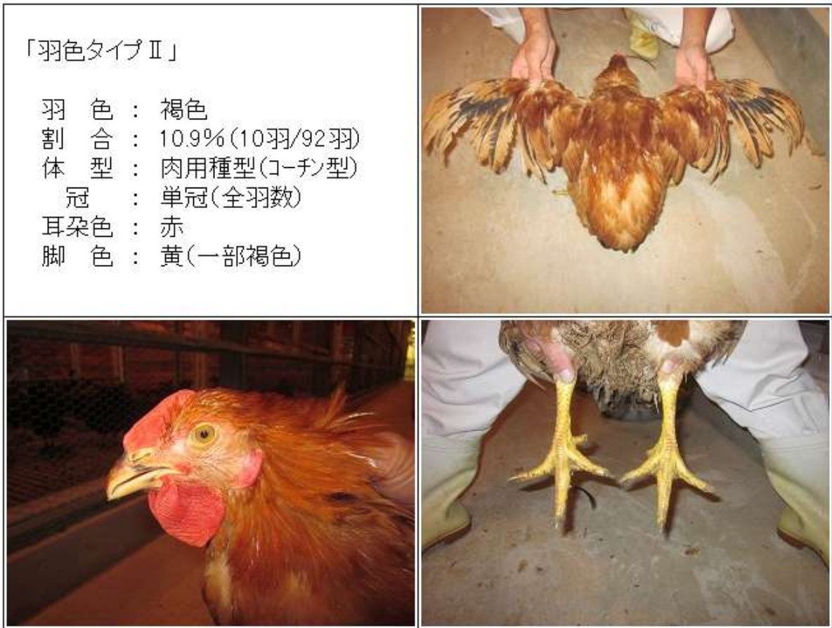
(図3-2) <57×86♂> (CM♂) 羽色タイプⅡの羽色・外貌の特徴