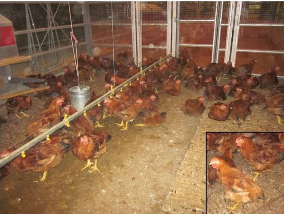
(図3-3) <57×86♂> (CM♂) の飼養状況(羽色の比較)